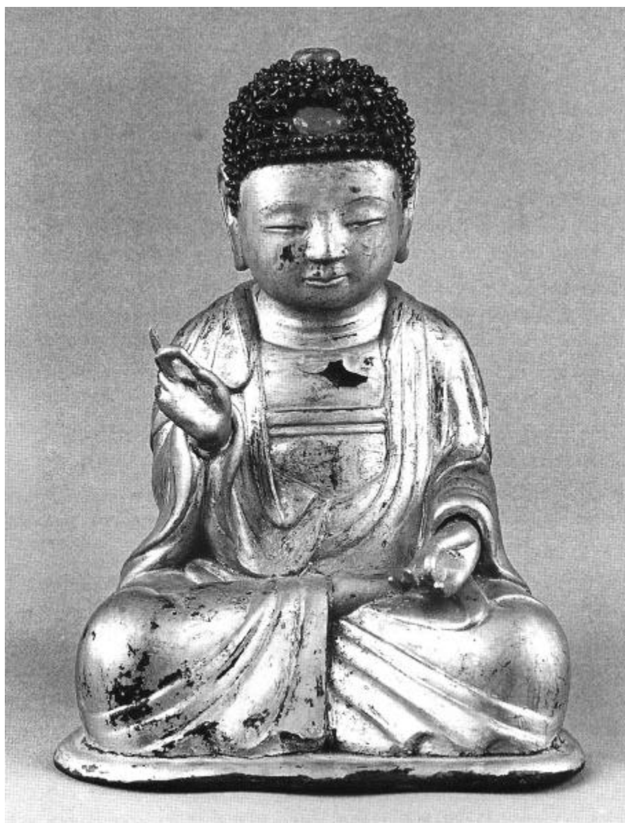
도1. 목조아미타여래좌상, 정면