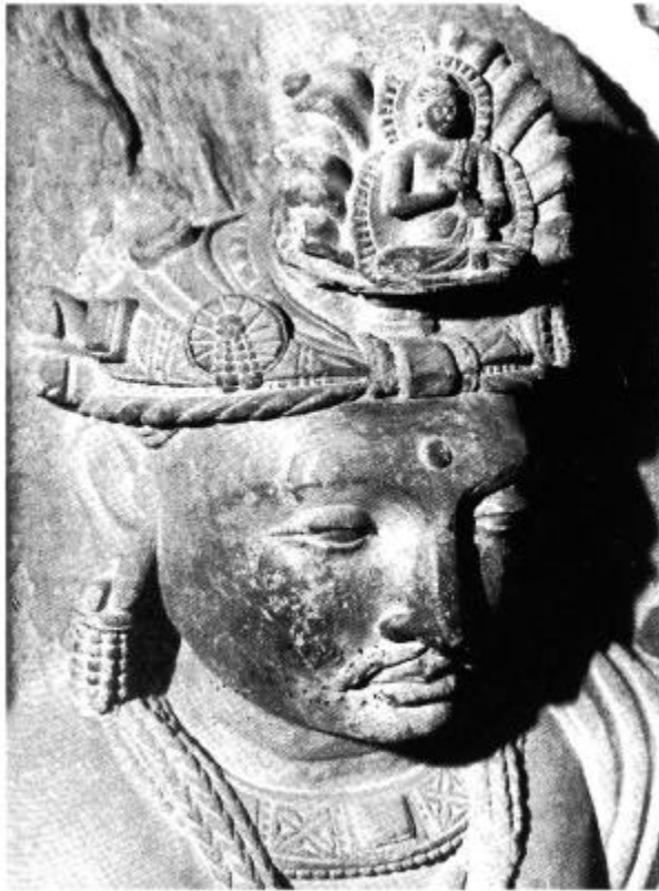
도 8. 관음보살입상(부분), Sahri-Bahlol 출토, 높이 98cm, 3-4세기, (출처: F. Tissot, Gandhara (1985), 도 184).