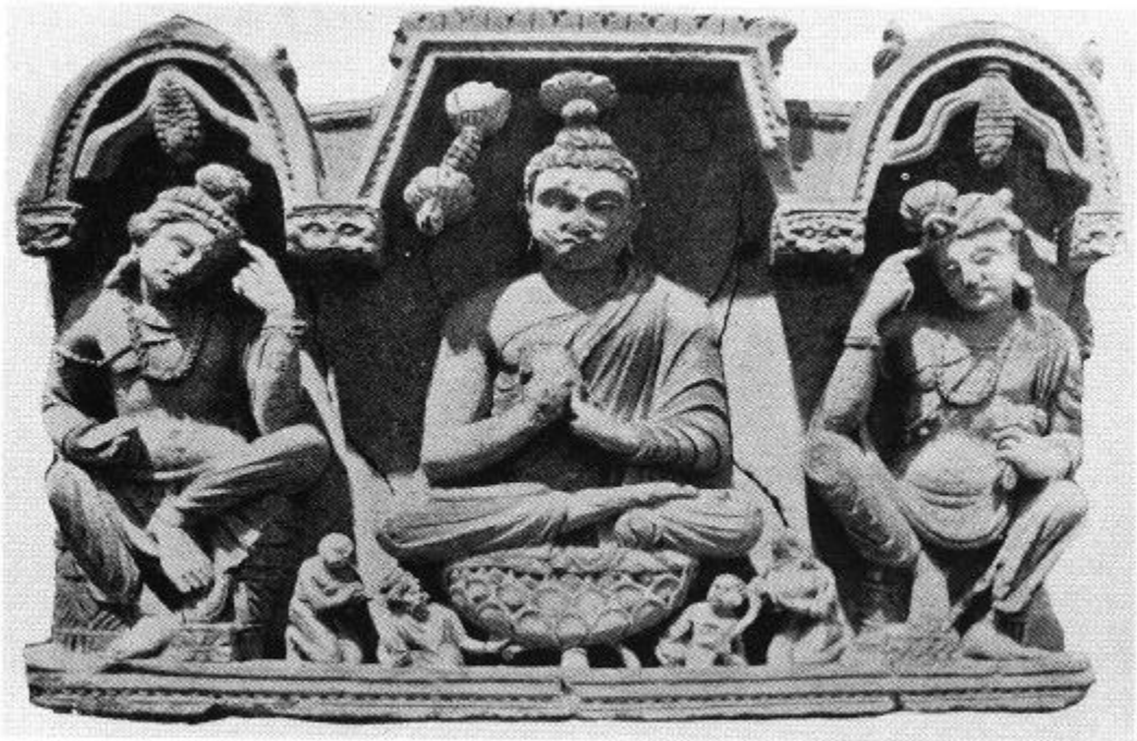
도 10. 불삼존상, Lorian-Tangai 출토, 높이 39cm, 3-4세기, 켈커타 인도 박물관 소장.

文殊 70) 梵夾 71) 圖像 72) 西晉代 譯出 『文殊師利般涅槃經』 '大 乘經典' 73) 가, , (Brough)가 華? 觀音形 , 가 가 가 阿彌陀 觀音, 大勢至 74)