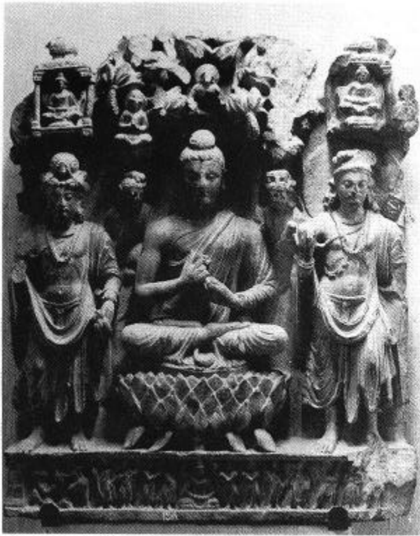
도 3. 불삼존상, Sahri-Bahlol 마운드 A 출토, 3세기, 높이 59cm, 페사와르 박물관 소장, (출처: 栗田功, 《ガンダ-ラ美術》1 (1989): 도 403).