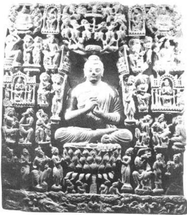
도 12. 불설법도 부조, Mohamed-Nari 출토, 높이 1m, 4세기, 라호르박물관 소장, (출처: 栗田, 1: 도 395).