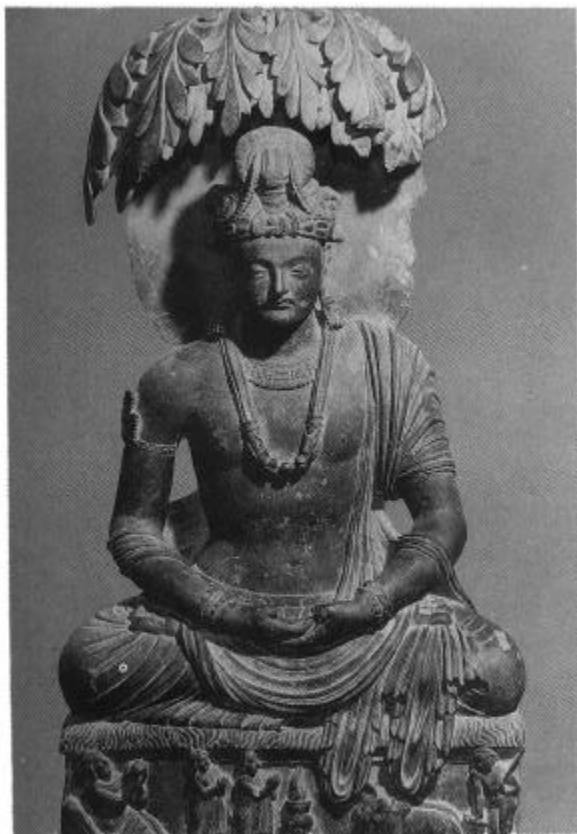
도 4. 싯다르타태자 禪定상, 3세기, 높이 68.6cm, 페사와르 박물관 소장, (출처: 栗田, 1: 도 131).