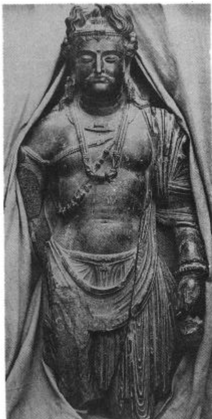
도 5. 미륵보살입상, 높이 1.3m, 3세기, 라호르 박물관 소장, (출처: 高田修, 《佛像の起源》 (1967), 도 42).