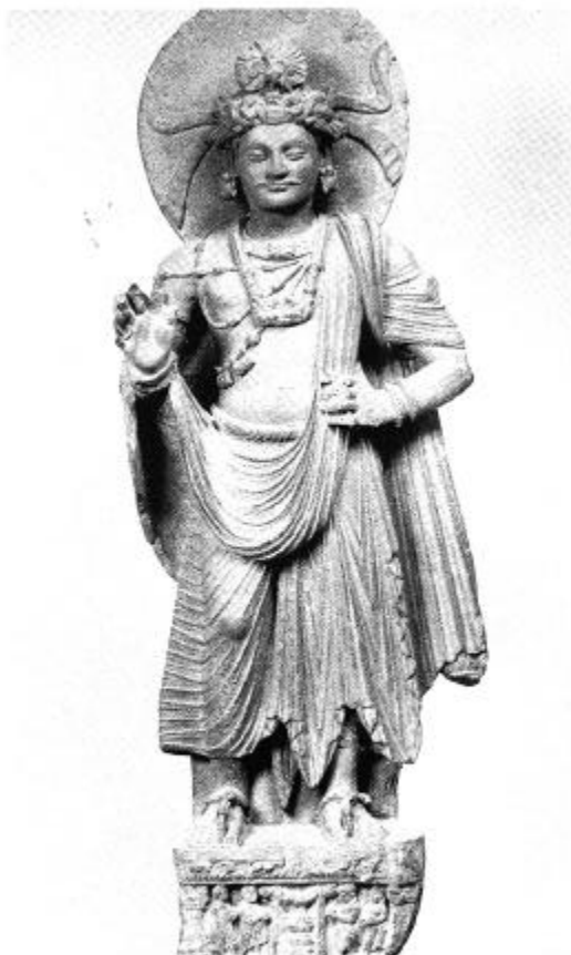
도 6. 싯다르타보살입상, Shahbaz-Garhi 출토, 높이 1.2m, 3세기, 기메 박물관 소장, (출처: 栗田, 2: 도 7).