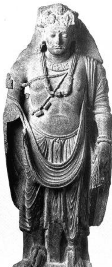
도 7. 관음보살입상, 3세기, 높이 1.7m, 로스엔젤레스카운티 박물관 소장, (출처: P. Pal, Indian Sculpture 1 (1986): 도 S45).