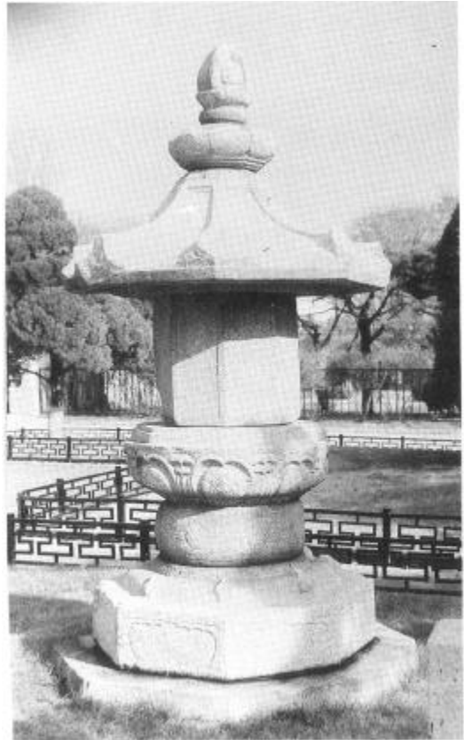
사진 8. 鳳林寺眞鏡大師寶月凌空塔 統一新羅(924년) 높이 2.9m

19) 塔碑 碑文 僧塔 가 立塔年代 大安寺寂忍禪師 聖住寺朗慧和繼塔 2 雙礪寺眞鑑禪師塔 碑塔 가 高達院 元宗 大師塔 2 19 34 가 가 가 8 5 圓鑑大師 碑塔 890 가 高達院