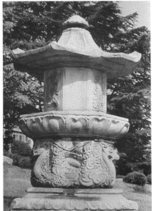
사진 22. 石造浮屠 高麗初期 높이 2.74m