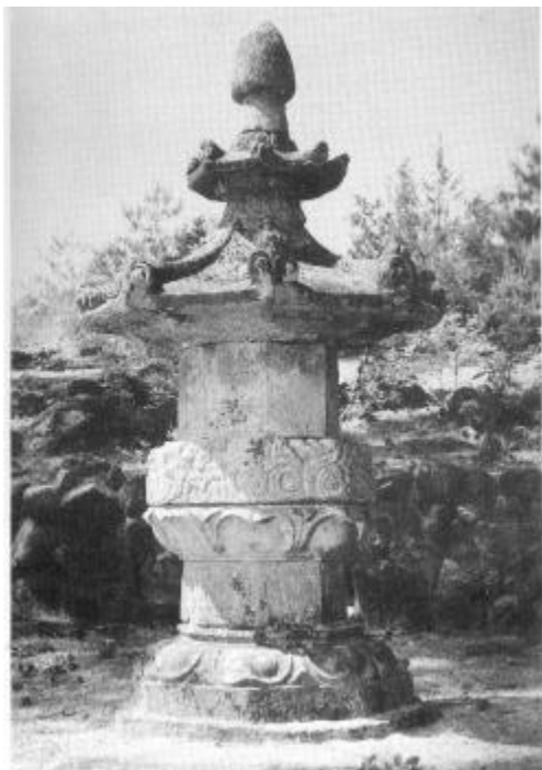
9. 雙溪寺浮屠 統一新羅(885 ) 2.05cm