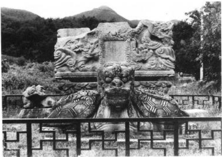
사진 3. 高達寺址元宗大師慧眞塔碑 高麗(977년) 높이 1.1m