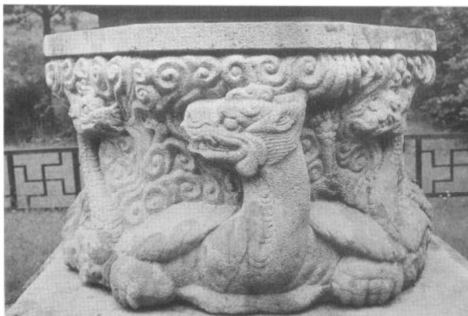
사진 6. 東塔(現 高達寺址元宗大師慧眞塔)基壇의 中臺石