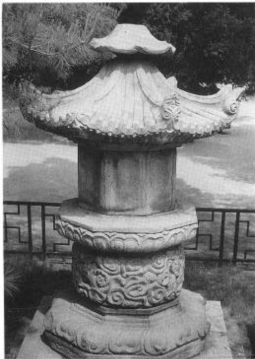
사진 21. 興法寺址眞空大師塔 高麗(940년 경) 높이 2.91m

圖鑑大師 가 873 碑塔 高達院 가 原州 興法寺 院宗大師 眞空大師가 住錫 開京 高麗太祖 王健 가 940 ( 21) 中 臺石 圓刻 雲龍文, 上下臺石 蓮瓣文, 相輪部 寶蓋 眼象 가 가 眞空大師塔 高達院塔系列 大師가 940 眞空大師塔 940 慶北大學校 石造浮屠( 22) 方形 方形 下臺石, 龜趺 龍文 中臺石, 蓮瓣文 上臺石, 四天王 無玄 中臺石 弧形 角形