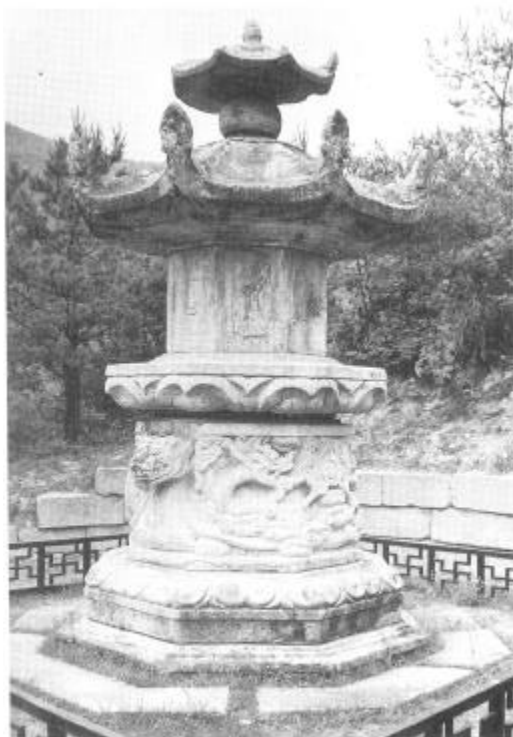
사진 2. 高達寺址浮屠(西塔) 高麗(977년) 높이 3.4m