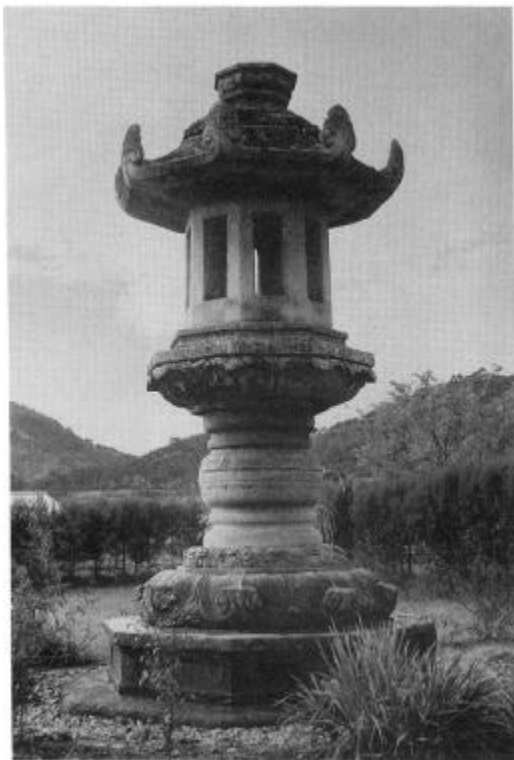
사진 18. 任實龍岩里石燈 統一新羅(9세기) 높이 5.18m