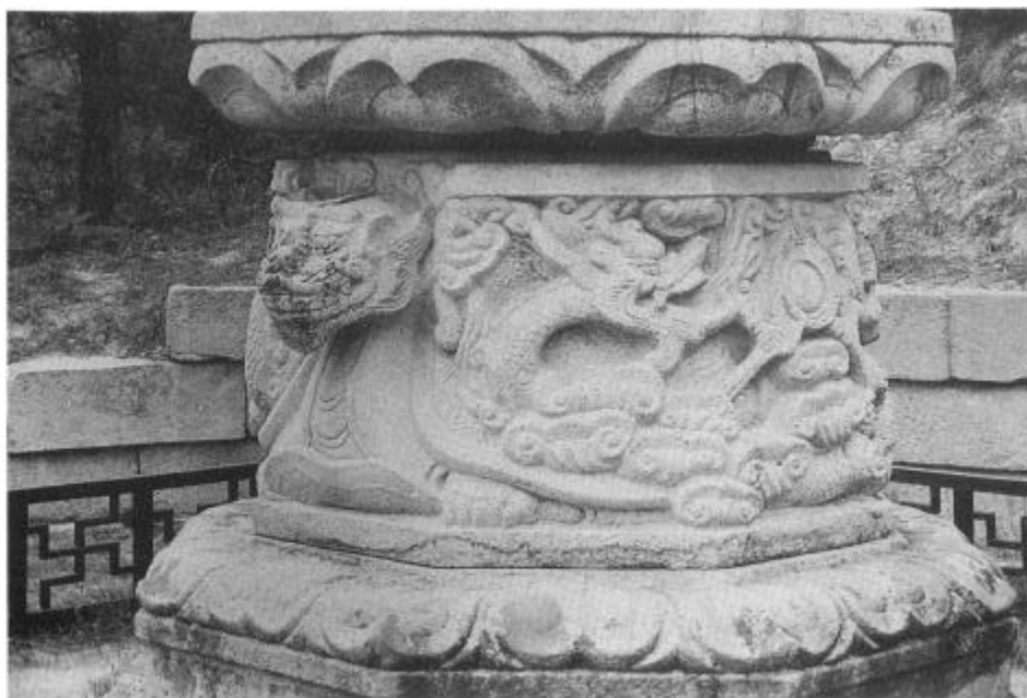
사진 5. 西塔(現 高達寺址浮屠)基壇의 中臺石