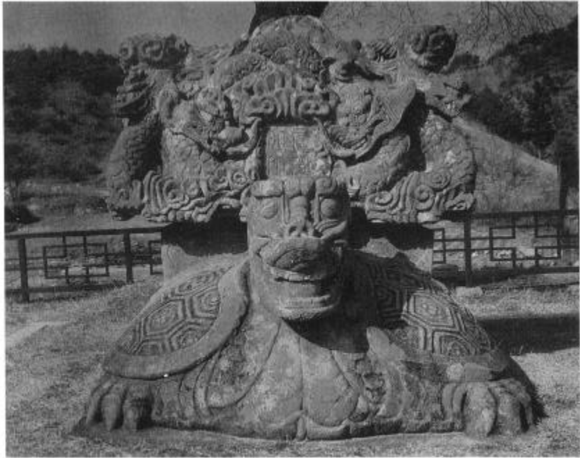
사진 4. 興法寺址眞空大師塔碑