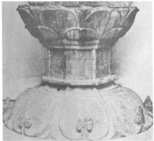
사진 14. 到彼岸寺鐵佛臺座 統一新羅(865년)