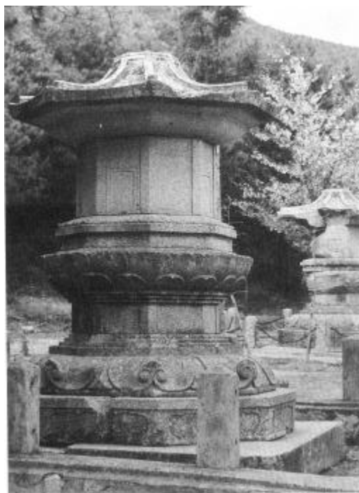
11. 望海寺址東西浮屠 統一新羅(9 ) 3.4cm(東塔), 3.3cm(西塔)