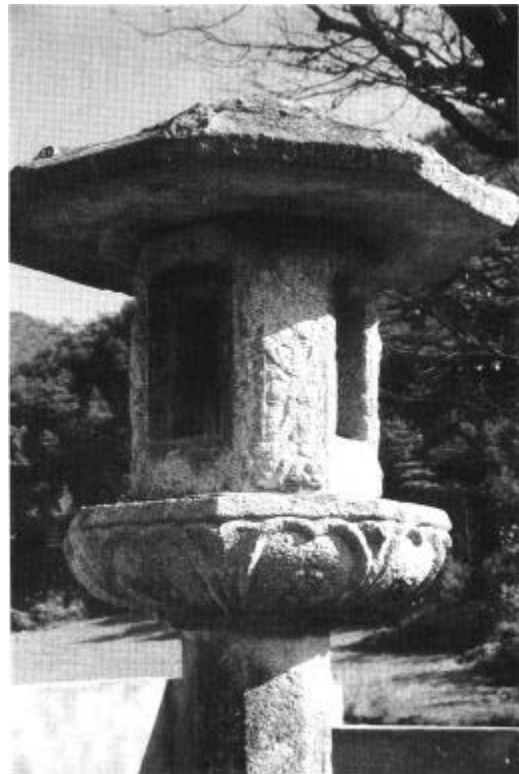
17. 陝川伯岩里石燈( ) 統一新羅(9 ) 2.53cm