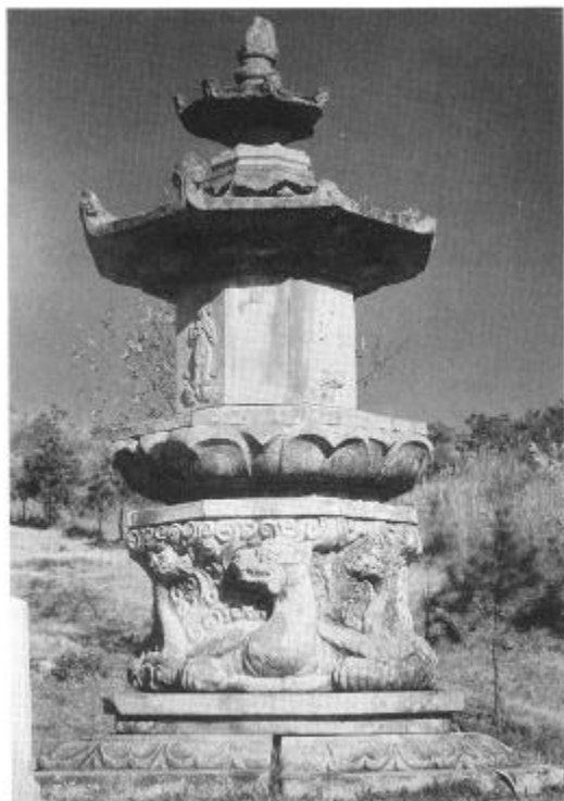
사진 1. 高達寺址元宗大師慧眞塔(東塔) 統一新羅(9세기 말엽) 높이 4.5m