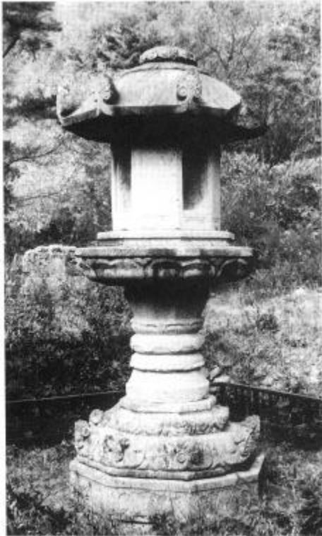
사진 20. 禪林院址石燈 統一新羅(9세기) 높이 2.92m