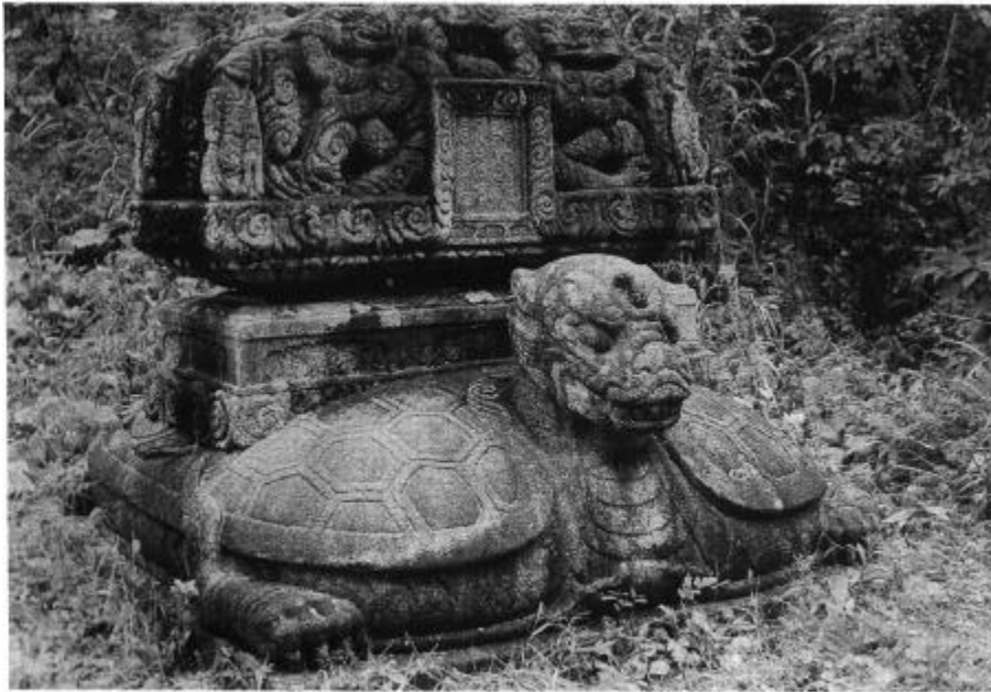
사진 15. 禪林院址弘覺禪師塔碑 統一新羅(886년) 높이 73cm(거북돌), 53.5cm(머릿돌)