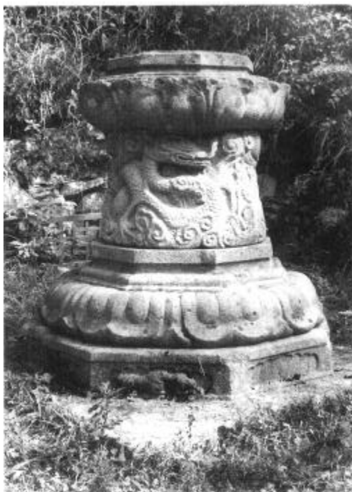
10. 禪林院址浮屠 統一新羅(885 ) 1.2cm