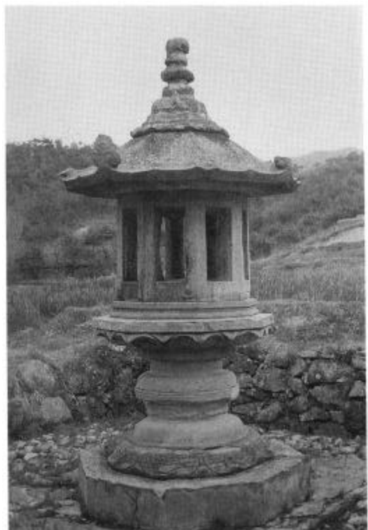
사진 19. 潭陽開仙寺址石燈 統一新羅(891년) 높이 3.5m