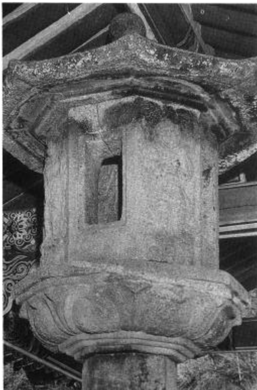
16. 法住寺四天王石燈( ) 統一新羅(9 ) 3.9cm