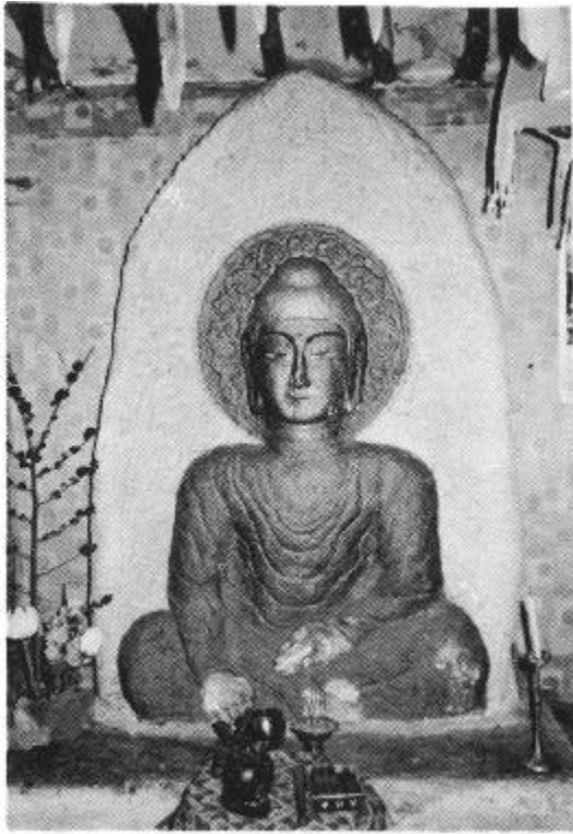
圖 1 羅州 龍雲寺 釋迦如來座像