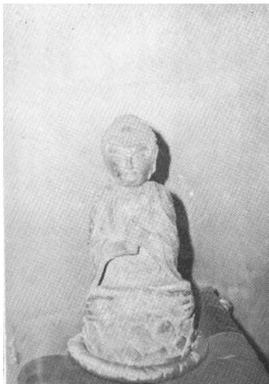
圖 8 光州 元曉寺出土 金銅毘盧舍那佛