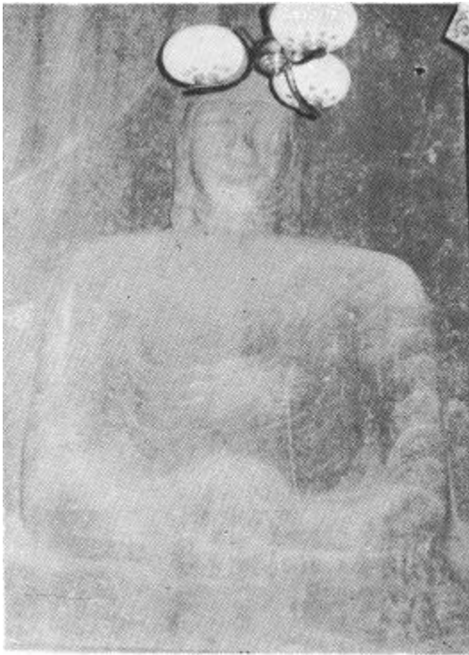
圖 4 光州 雲泉寺 磨崖如來座像