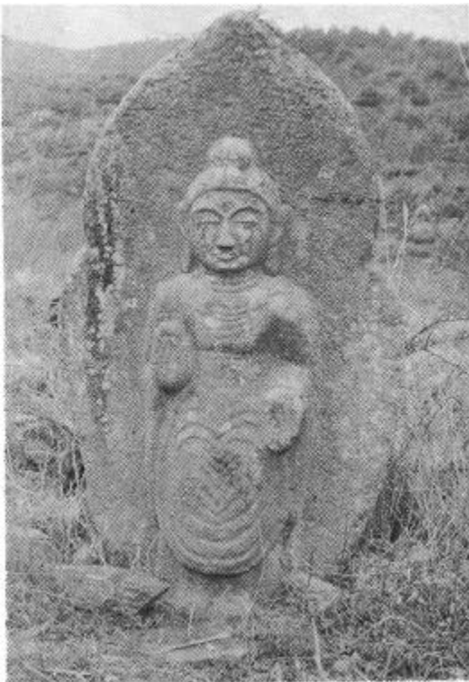
圖 2 羅州 萬峰里 石佛如來立像