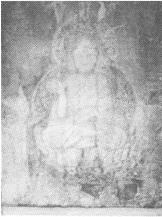
圖 3 光州 石佛庵 磨崖如來座像

立石臺 가 奇岩 方形 整齊 片岩 石理現象 石造龕室 磨崖佛 彫 刻 緣由 石佛庵 石窟庵 東國輿地勝覽 光山縣 佛字條 圭峰寺 風穴臺 (「風穴在 圭峰寺傍石壁下長一尺廣五寸 風或生或止俗 名其石壁爲風穴臺)가 石 佛 言及 佛像