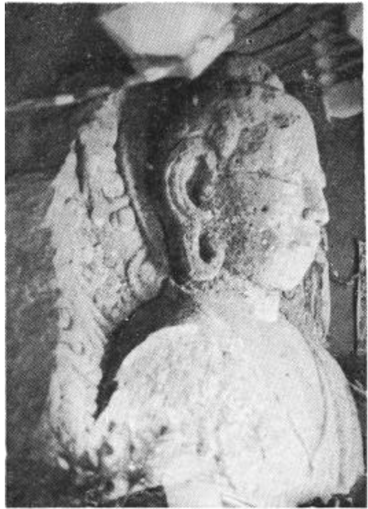
圖 5 長興 龍華寺 藥師座像(側面)

火焰文 花文 彫飾 餘白 佛像 樣式 頭頂 肉가 磨崖佛 螺髮 磨滅 半 素髮 兩眉間 白毫孔 冥想 眼 가 가 , 全體의 硬直 三道가 手印 細部 彫刻 形式的 刻出 調化 法衣 右肩偏袒 結跏趺坐 衣褶 手印 五指 丹田 冥想 思惟 大日如來가 取 法界定印(禪 定印) , 寶珠 特異 手印 佛像 磨崖如來座像 佛像 樣式 製作年代 岩壁 一面 陽刻 浮彫 特異 手印 造座像(寶物 二九六號, 高麗時代) 參禪 法界定印 手印 扶餘 軍守里出土 石造如來座像(寶物 三二九號, 三國時代), 金銅菩薩入像(寶物 二八 五號, 三國時代, 全晟雨氏 所藏) 가 三重 輪光形光背 高麗時代 所作 靈岩 道 岬寺 石造如來座像(寶物 八九號, 高麗時代) , 平行段像 圖式化 右肩偏袒 手法 新羅 國立博物館 所藏 春宮里 鐵造釋迦如來座像 高麗初 事實的 硬直 高麗 가 彫刻手法 巨大化 體軀 圖式化 衣褶, , 蓮花紋 下部 春宮里 鐵造釋迦如來座像 高麗初 佛像 年代가 高麗的 要素