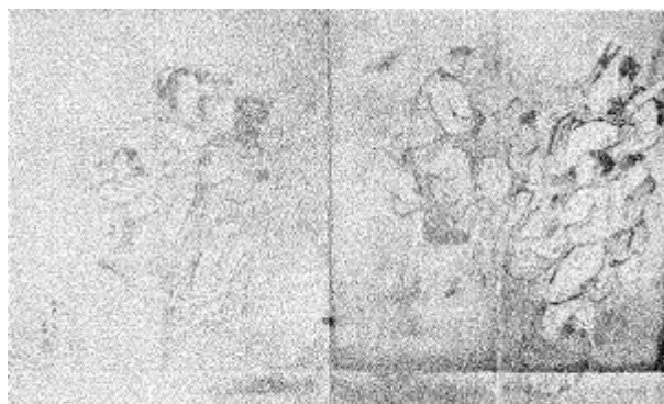
檀園金弘道 丙申年 作

. 序言 記述 檀園 金弘道 生年 壺山外史 金弘道傳 正確 十五年 加 上 卒年 遺墨帖 資料 가 推定 . 遺墨帖 題跋 人士 款識干支 中 上限 宏雅堂學人