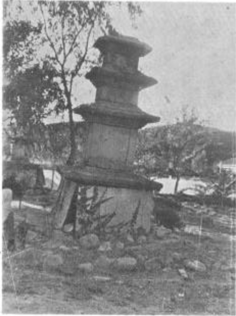
奉化 西洞里 三層 石塔 (寫眞 1)

一九六二年 十月 下旬 慶北 奉化郡 春陽面 西洞里 春陽中學 校庭 東西三層 石塔(註1· 寶物第五二號) 解體修理 . 雙塔 規模가 同一 二層基壇上 方形塔 四四·五尺 距離 對立 基壇부가 埋沒弛緩 倒壞 가 .(寫眞1) 十月二十八日 東塔 第一塔身 創 建當時 推定 貴重 舍利具가 收拾 紹介 . 筆者가 現 場 遺物 調査 舍利具가 發見 郡廳 直後 經緯 工事擔當者 聽取 添言 .(註2)