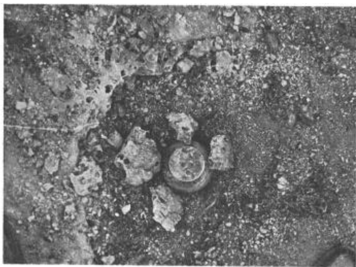
舍利 裝置 檢出狀態(寫真 2)