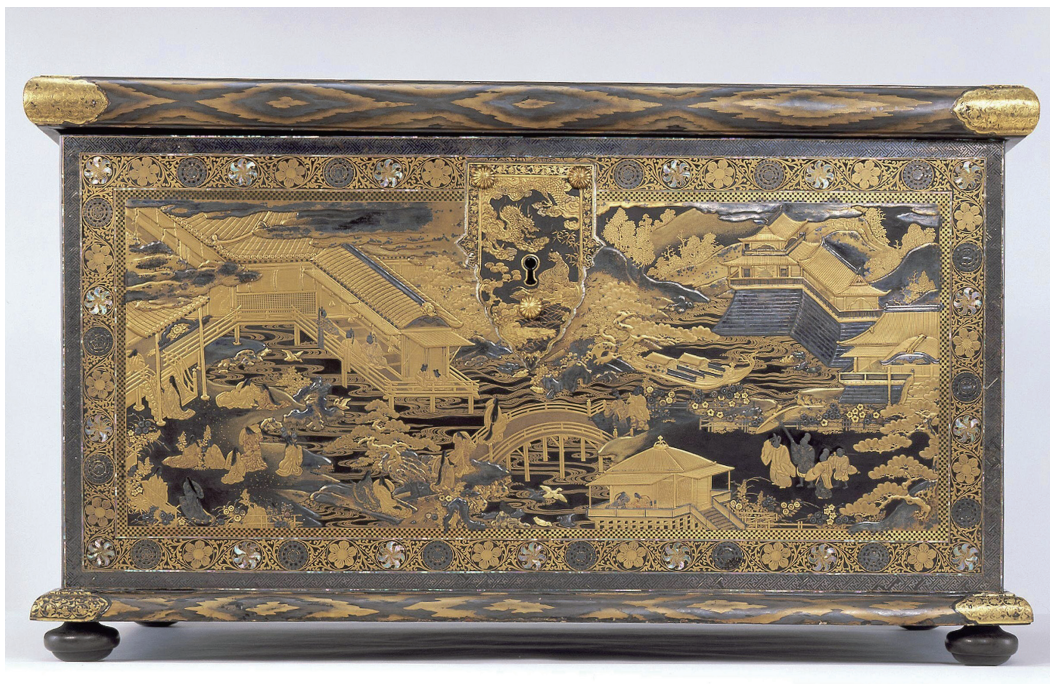
원색도판 4, 마자랭 칠기함, 일본, 1630-1650년, 나무에 칠 · 금 · 은 · 구리 합금 · 구리, 100.3×56.5×63.5cm, 영국 빅토리아앨버트박물관