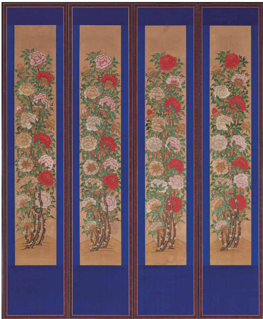
원색도판 2. 필자미상, 〈모란도 4폭 병풍〉, 20세기 초, 견본채색, 각 폭 330×27cm, 국립고궁박물관(창덕6424)