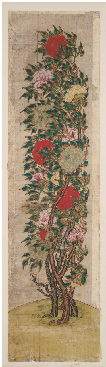
원색도판 1. 필자미상, <모란도 2폭 障子>, 조선, 견본채색, 화면 각 240×54.5cm, 국립중앙박물관(M96)