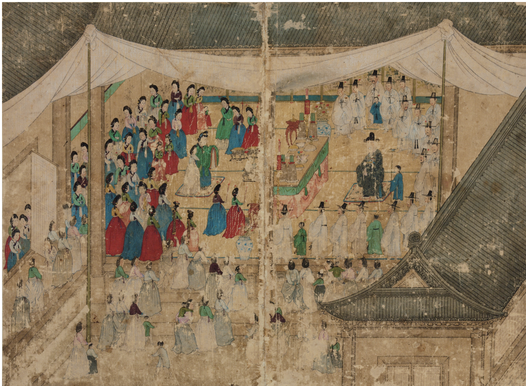
원색도판 5. 필자미상, 〈교배례도〉, 《회혼례도첩》, 조선 후기, 건본채색, 33.6×45.6cm, 국립중앙박물관(탁수6375)