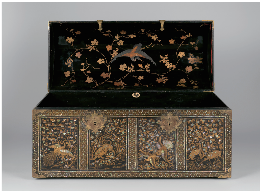
원색도판 3. 남만 칠기함, 일본, 1600년경, 나무에 칠 · 금 · 은 · 자개, 63.5×125×54.5cm, 미국 메트로폴리탄 미술관