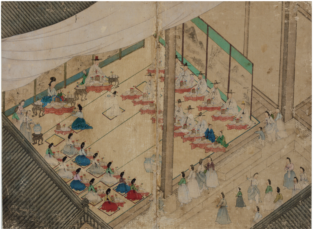
원색도판 6. 필자미상, 〈한수도〉, 〈회흔례도첩〉, 조선 후기, 견본채색, 33.6×45.6cm, 국립중앙박물관(덕수6375)