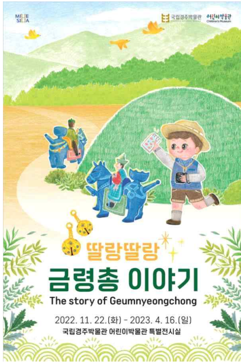
어린이박물관 특별전시 “딸랑딸랑 금령총 이야기”