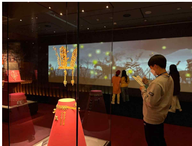
교육프로그램 참고 사진