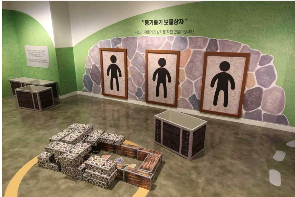
무덤 만들기 교구재 (돌무지, 목관, 꺼묻거리 등)