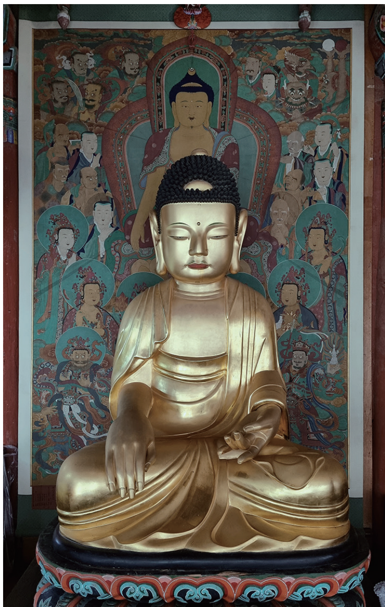
원색도판 7-2. 화엄사 대웅전 목조석가불좌상, 1634년, 245cm, ©유근자