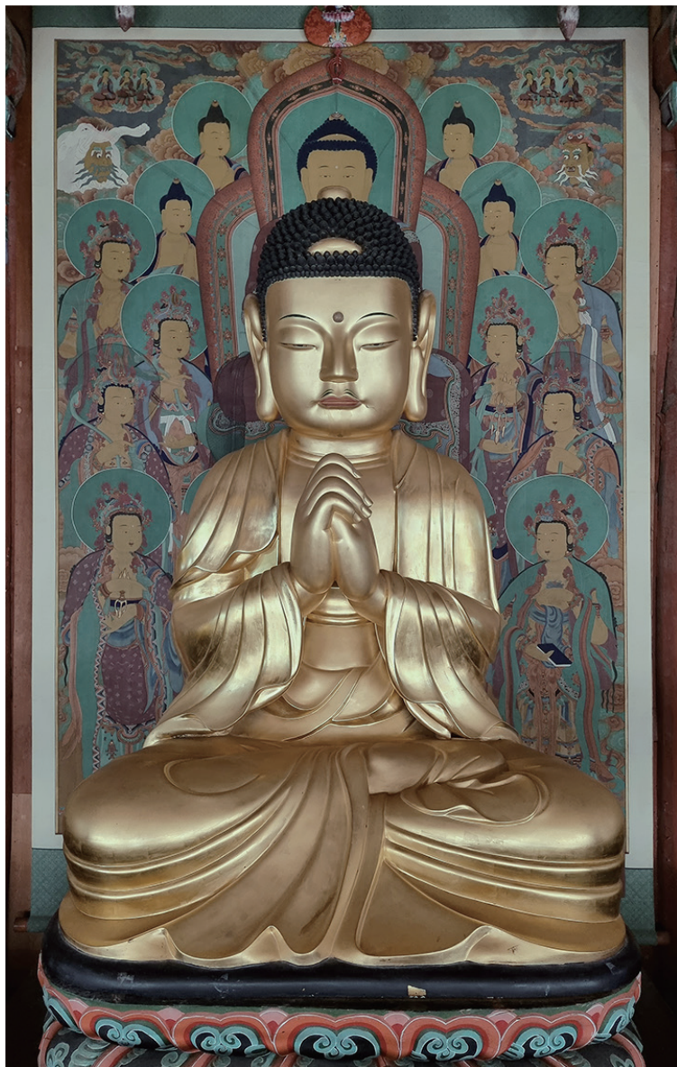
원색도판 7-1. 화엄사 대웅전 목조비로자나불좌상, 1634년, 280cm, ©유근자