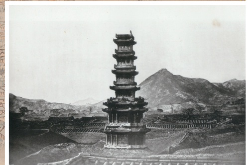
원색도판 4. 퍼시벌 로웰(Percival Lowell)이 촬영한 원각사탑 사진, 1884년