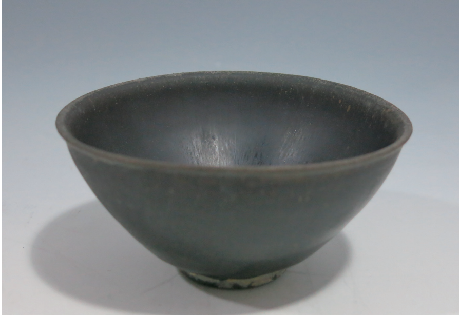
원색도판 5-1. "공어"명 흑유완, 南平市建陽區博物館