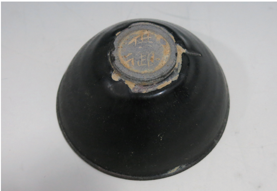
원색도판 5-2. "공어"명 흑유완의 背面, 南平市建陽區博物館