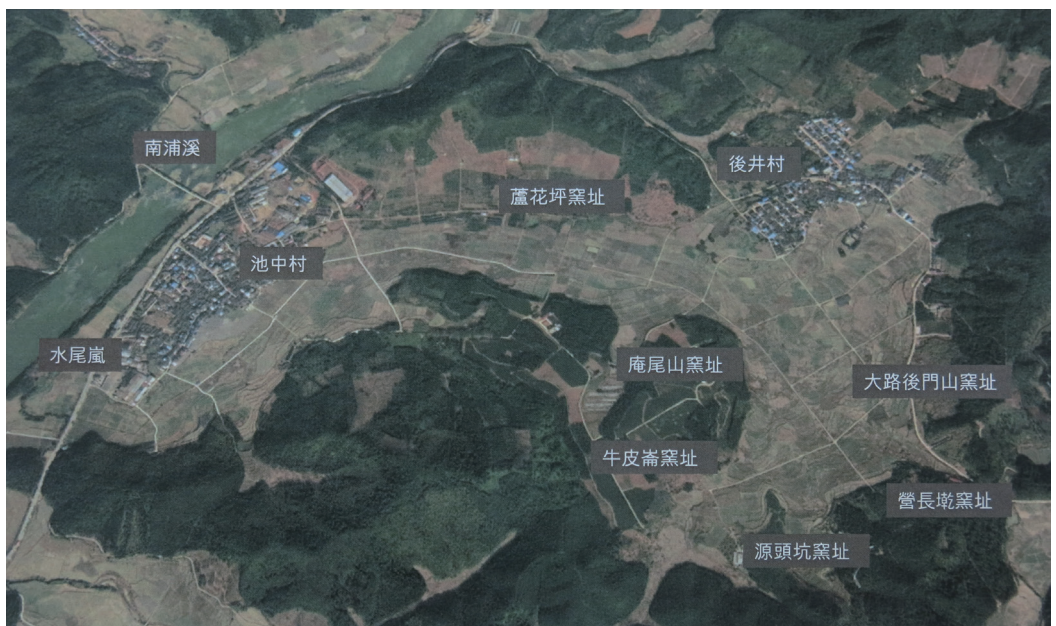
원색도판 6. 건요(建窯)요지 분포도