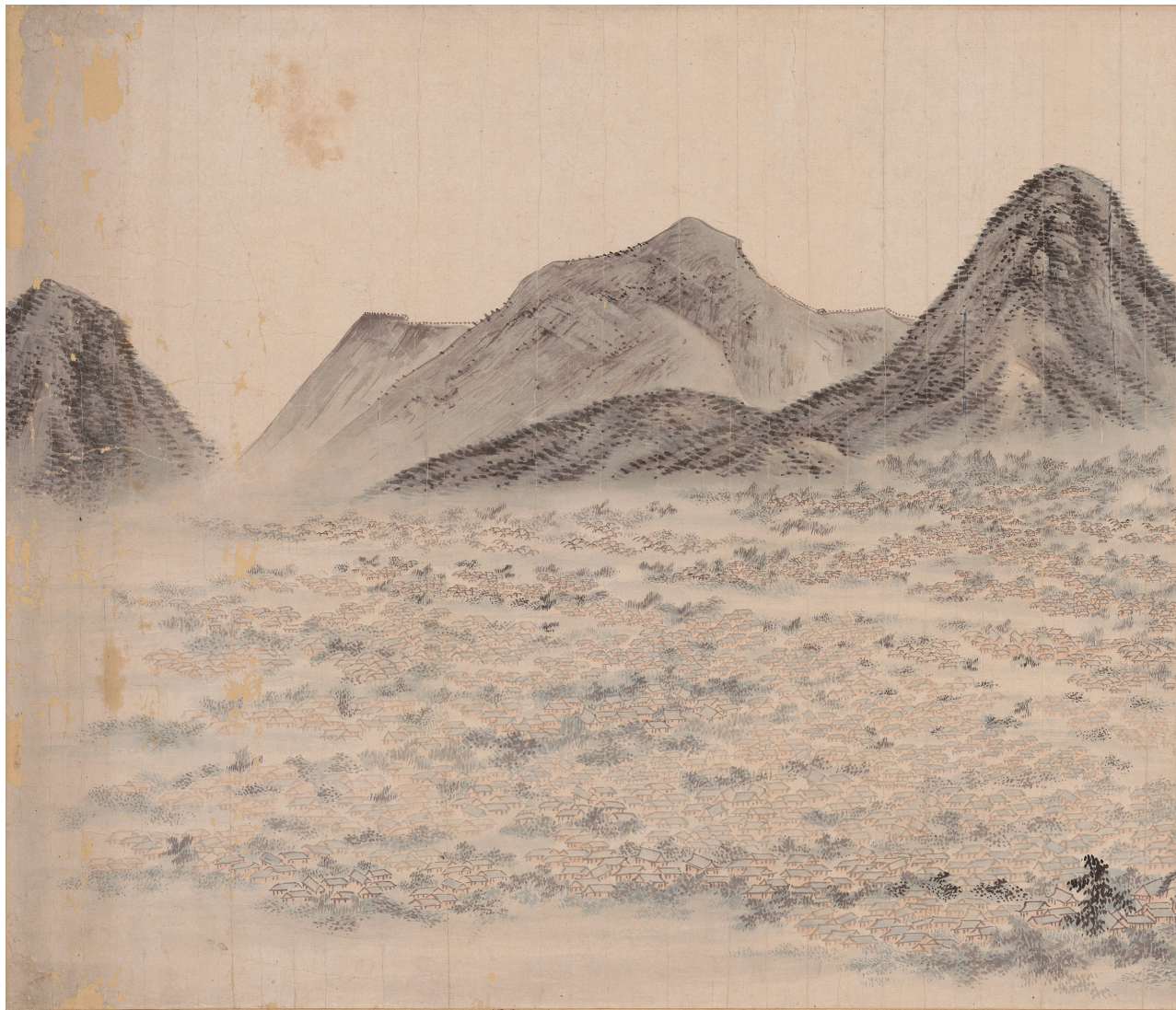
원색도판 3. 〈京城圖〉, 19세기 초, 57.6×133.9cm, 국립중앙박물관(덕수3256) * 단층 지붕 위로 우뚝 솟은 원각사탑(漢陽全景圖 부분)