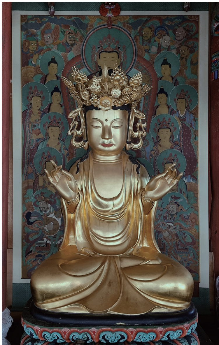
원색도판 7-3. 화엄사 대웅전 목조노사나불좌상, 1634년, 264.5cm