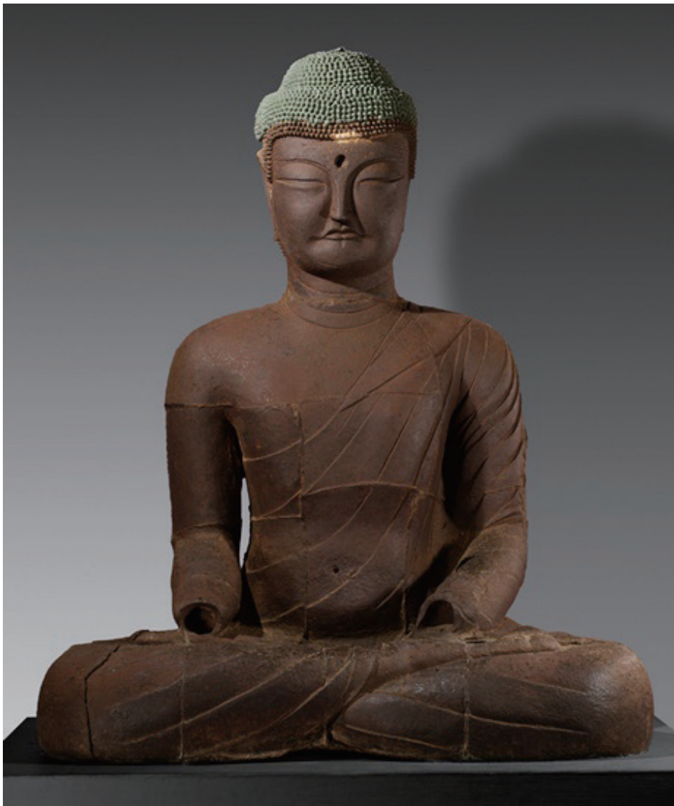
원색도판 1. 보원사 철조여래좌상, 높이 259cm, 국립중앙박물관(본관5191)