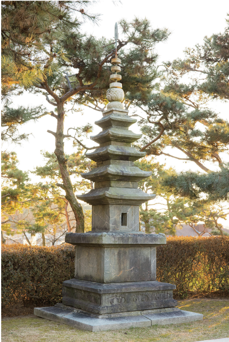
원색도판 4. 부여 동사리사지 오층석탑, 고려 11세기(1028년 추정), 현재 높이 4.5m, 충청남도 문화재자료 제121호, 국립부여박물관