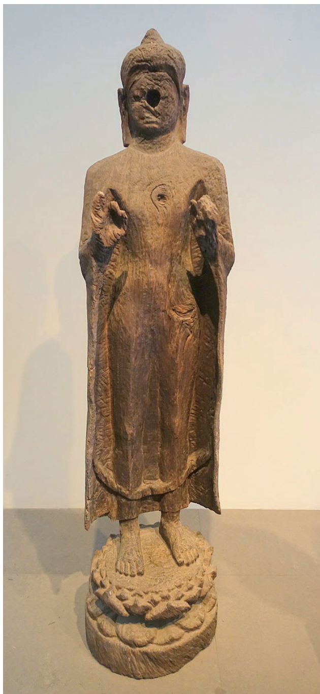
원색도판 2. <불입상>, 6세기경, 나무, 높이 약 177cm, 호치민시 베트남역사박물관