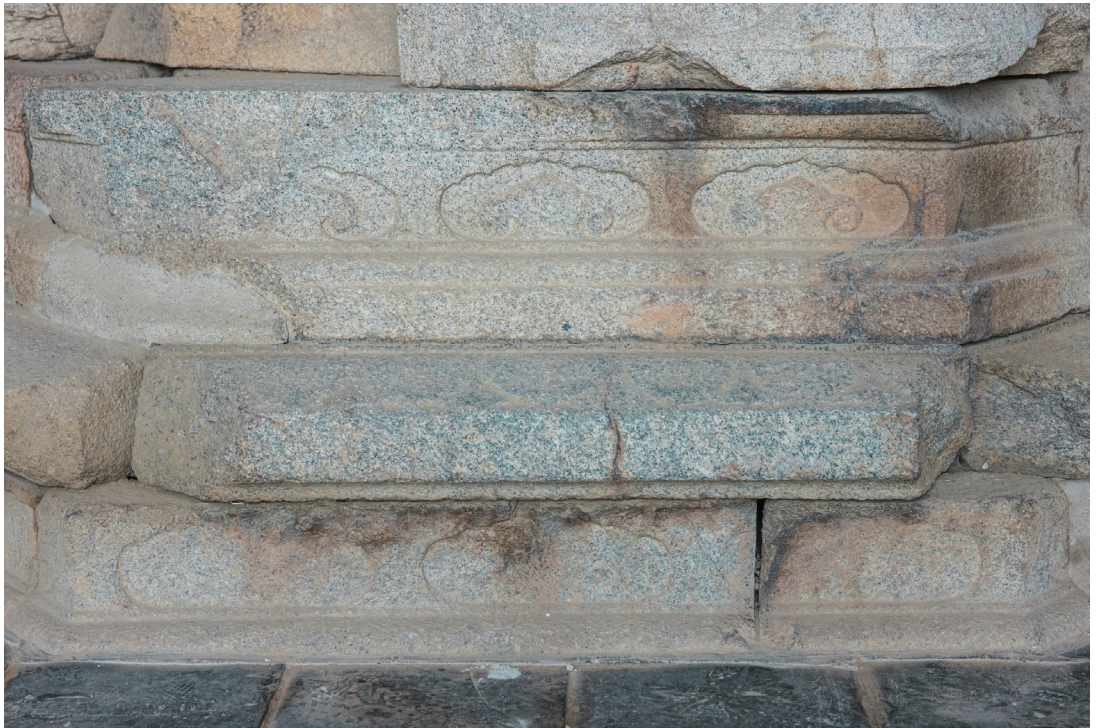
원색도판 5. 부여 정림사지 석불좌상 대좌, 고려 11세기(1028년 추정), 보물 제108호, 부여 동남리