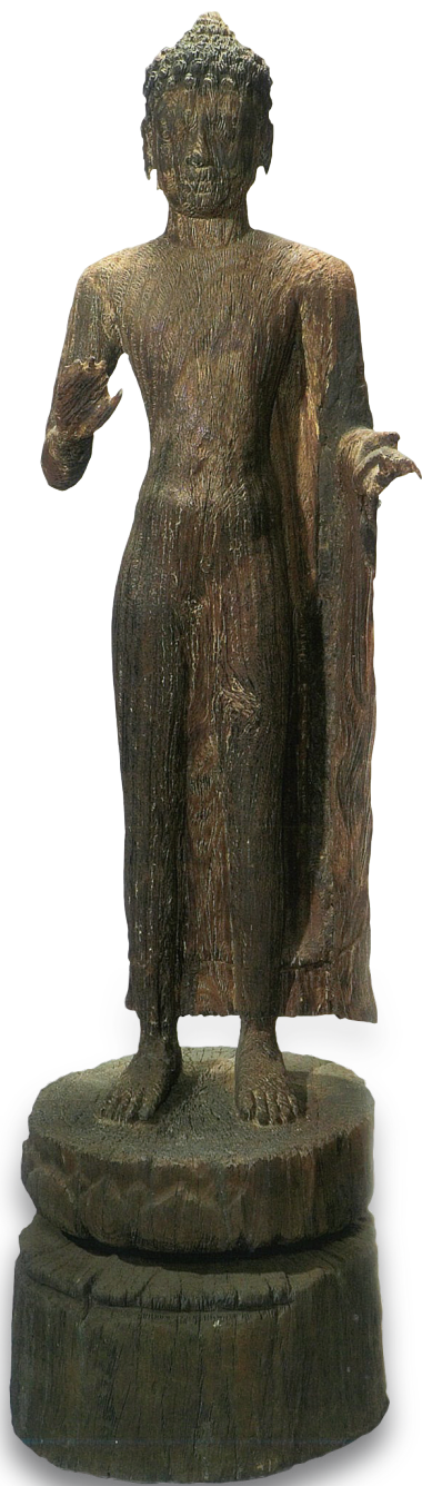
원색도판 1. 〈불입상〉, 6세기경, 나무, 높이 133cm, 호치민시 베트남역사박물관