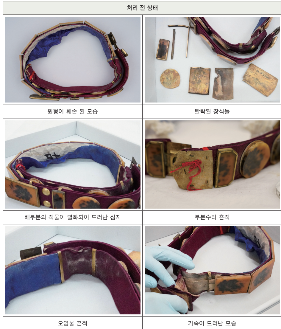
표2. 처리 전 손상부위