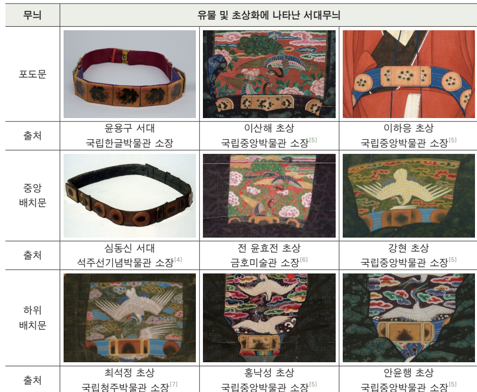
표1. 유물 및 초상화에 나타난 서대무늬

서대의 재료는 무소뿔[서각]로 갈색바탕에 흑갈색의 무늬가 있는 것이 특징이다. 그 무늬는 선행 연구를 통해 크게 세 종류로 분류되었다. 첫 번째는 통천서라 불리는 최상급의 서각으로 띠돈의 중앙에 밝은 빛이 돌면서 주변으로 작은 원형의 흑갈색 무늬가 중앙에 밀집한 모습으로 『임하필기』에서는 납색포도문이라고도 하였다. 두 번째는 밝은 갈색바탕 중앙에 흑갈색의 무늬가 응집된 형태이다. 세 번째는 바탕 아래쪽으로 흑갈색 무늬가 치우친 형태가 있다 [3] . 서대는 실물의 유물보다 초상화에 많이 남아있으며, 본 연구에서는 세 가지의 무늬를 특징별로 포도문, 중앙배치문, 하위배치문으로 명명하여 표1에 정리하였다. 그 결과 윤용구 서대의 무늬는 포도문과 유사한 양식으로 확인된다.