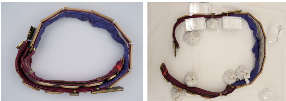
도5. 형태복원 과정

오랜 시간 건조한 환경에 있었던 대의 원형을 복원하기 위해 미세하게 가습기를 이용하여 습도를 올려서 가죽과 직물에 유연도를 주면서 형태를 잡아주었다. 단단해진 가죽이 한 번에 형태를 잡아주면 부러질 가능성이 있으므로 천천히 시간차를 주고 이동하여 고정시켜주는 작업을 진행하였다. 적정 온습도(20℃, 50% RH)에서 형태가 고정될 수 있도록 자연건조를 시켰으며, 이를 통해 전체적으로 생긴 불필요한 구김과 형태를 함께 제거해 주었다 (도5) .