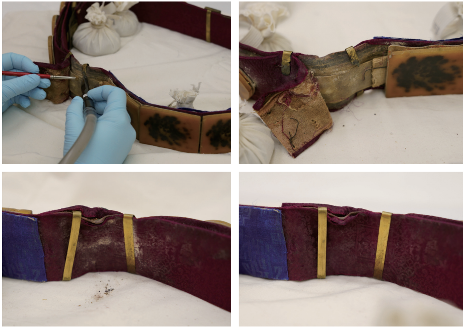
도4. 세척 과정