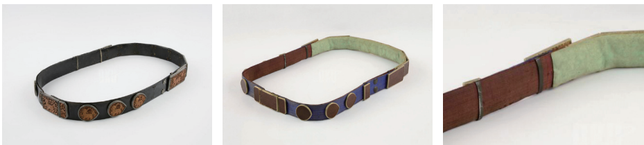
도3. 일체형 구조(석주선기념박물관 소장) [4]