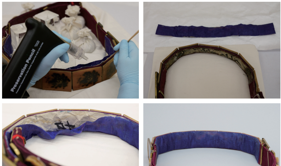
도6. 배부분 처리과정

직물부분의 보수가 끝난 후에는 분리되었던 장식품과 떨어져 있던 가죽들을 고정하는 작업을 하였다. 무소뿔은 모두 얇은 가죽을 사용하여 받침을 사용하였으며, 틀과 연결은 가죽에 철사를 끼워 부착되어있다 [도7(a)] . 원형의 남두육성은 금속테가 없