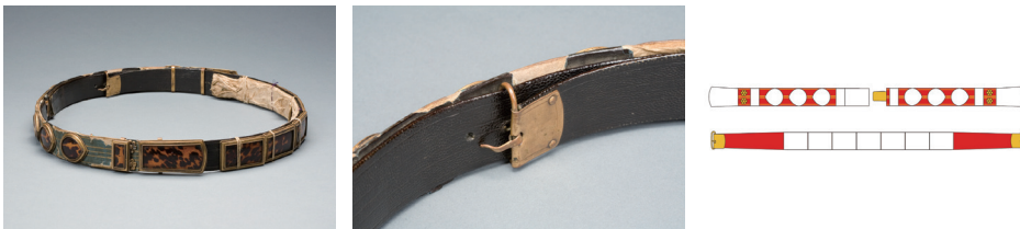
도2. 분리형 구조(석주선기념박물관 소장) [4]

19세기 이후에는 원형에서 타원형 그리고 방형으로 변하면서 양 옆면의 버클이 없어지고, 3조각이 분리가 되지 않는 일체형 구조로 변화되는데, 본 연구의 대상인 윤용구의 서대는 방형의 일체형 구조에 해당된다 (도3) .