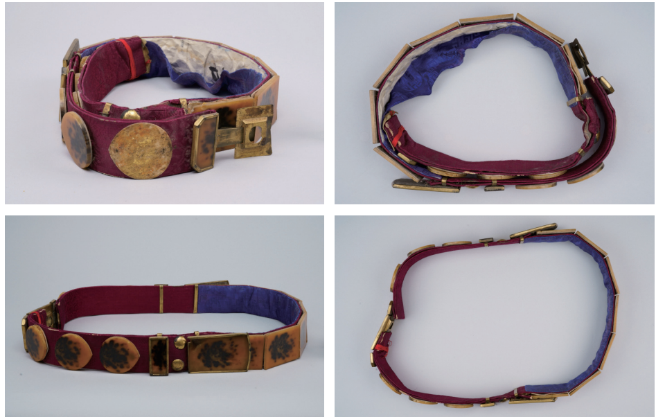
도8. 서대 보존처리 전·후

보존처리가 완료된 후 온도, 습도, 조도, 충해 등의 환경적 요인과 취급 부주의로 인한 2차 손상을 막기 위해 보관이 용이하도록 포장작업을 진행한다. 유물간의 상호 마찰로 인해 추가 손상이 발생 할 수 있기 때문에 보존용지를 사용하여 마찰부위를 지지하여 준다. 또한 형태가 변형되지 않도록 고정 틀을 만들어 완충과 고정의 역할을 할 수 있도록 포장하여 보관하여 준다.