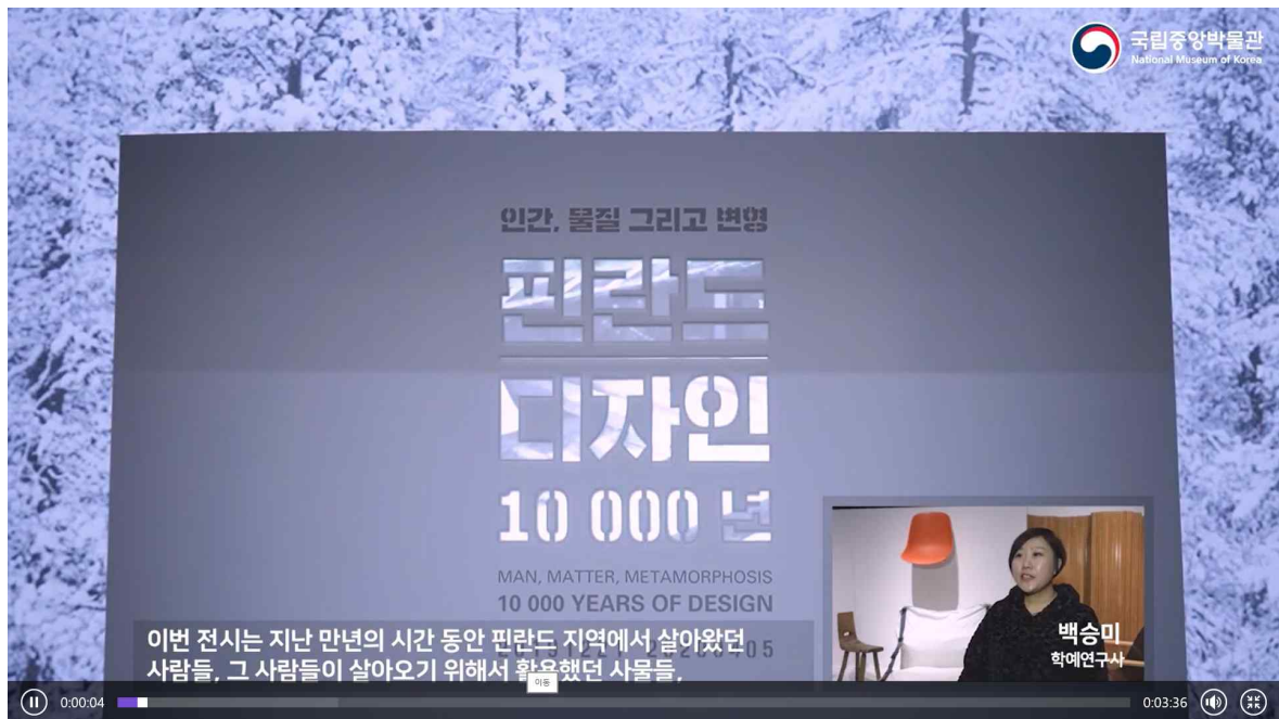
‘핀란드 디자인 10 000년’ 특별전 동영상